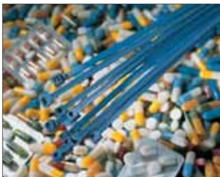
En säker och oförorenad produktionsprocess med MCT.