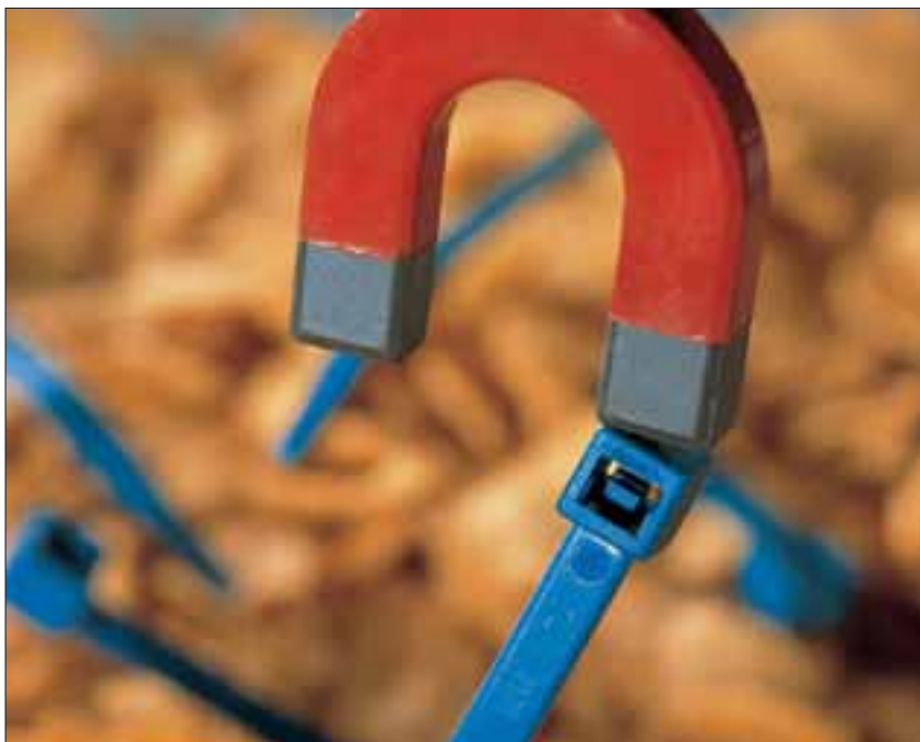
MCT med metallinnehåll.

Det metallinnehållande buntbandet är speciellt utvecklat för användning inom livsmedels- och läkemedelsindustrin. En unik tillverkningsprocess med inblandning av metallpigment gör det möjligt att även små bitar från bandet kan detekteras av en metalldetektor. Det gör banden lämpliga att användas för installationer i och omkring tillverkningsprocessen.