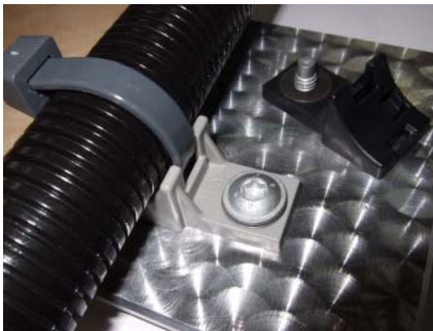
Dessa HDM band kan fästas med antingen skruv eller bult.

Används inom industrin som fixering av kablar och slangar.